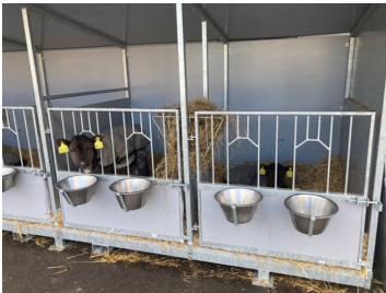
Midteradskillelse mellem to enkeltbokse i kalvevogn er fjernet.