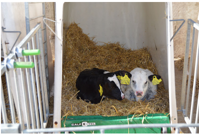
XXL hytte med plads til to små kalve.