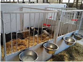
Midteradskillelse mellem to enkeltbokse er fjernet.