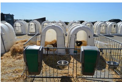
Parvist opsætning af kalvehytter med fælles forgård. Bemærk god afstand til næste par.